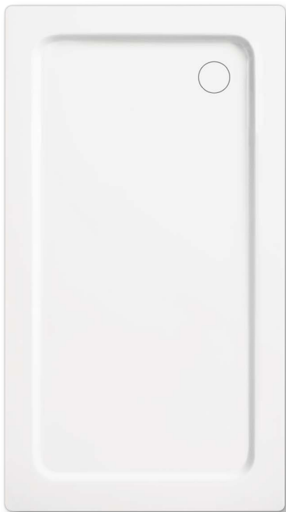
Model 444 z nośnikiem ze styropianu