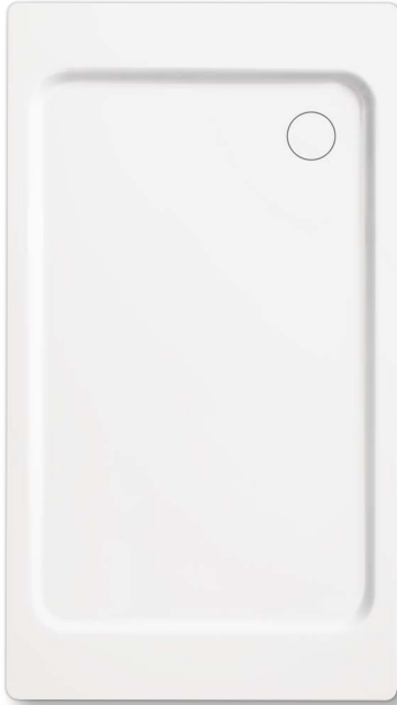
Model 440 z nośnikiem ze styropianu