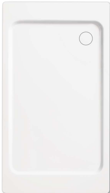
Model 447 z nośnikiem ze styropianu