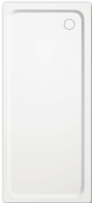
Model 447 z nośnikiem ze styropianu